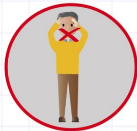
РАК ГУБЫ, ЯЗЫКА